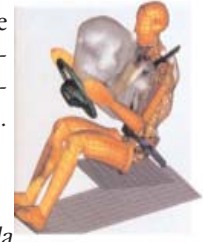
Airbags Coussins gonflables de sécurité

Le comité de travail continue, sans relâche, d'exercer ses pressions sur le gouvernement et la SAAQ en vue de faire adopter l'amendement qui permettra la remise sur le marché des coussins gonflables. Dans l'intervalle, il est toujours interdit, au Québec, de réparer des modules de coussins gonflables déjà déployés sous peine d'amende pouvant varier de 3 000 $ à 9 000 $. Nous rediffusons le rappel de la SAAQ à ce sujet, dans son communiqué de mars 2006.